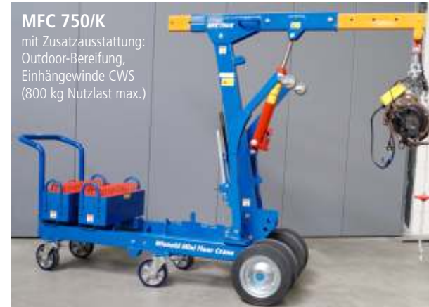
MFC 750/K mit Zusatzausstattung: Outdoor-Bereifung, Einhängwinde CWS (800 kg Nutzlast max.)