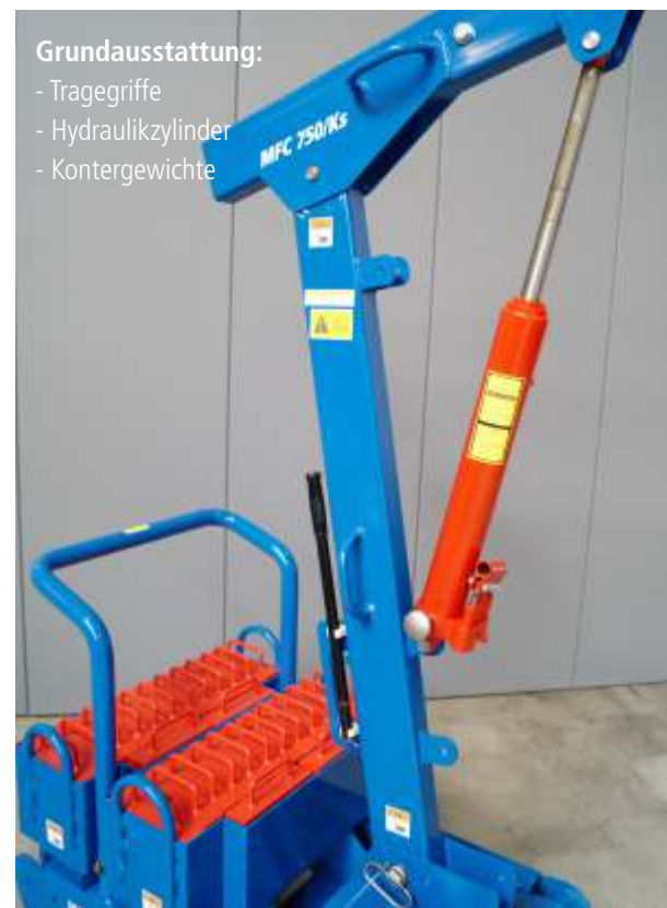
Grundausrüstung: - Tragegriffe - Hydraulikzylinder - Kontergewichte